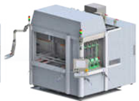
2 Arbeitsräume asymmetrisch, 2x Steuerung 2 work enclosures asymmetrically, 2x control system