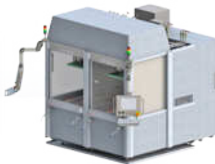
2 Arbeitsräume, 2x Steuerung 2 work enclosures, 2x control system