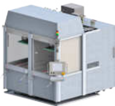
2 Arbeitsräume, 1x Steuerung 2 work enclosures, 1x control system

Modern technology in small space Perfect solution for long or big work pieces Full supply for modern ECM-Technology Equipment adaptable to requirement