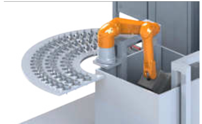
Delta 3D-ECD-Maschine für große und schwere Hydraulikblöcke Delta 3D-ECD-Machine for large and heavy hydraulic blocks